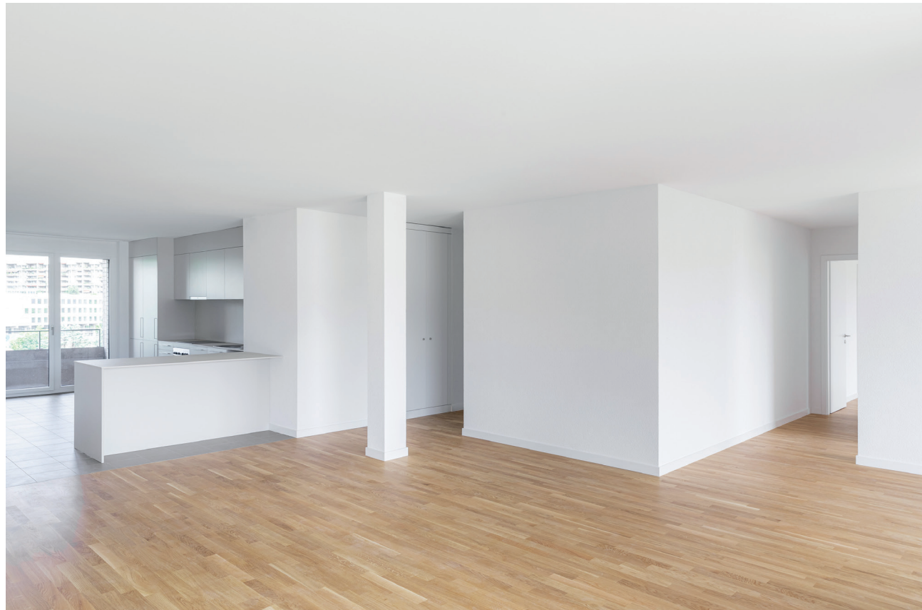
THINK UTOPIA THINK UTOPIA

Ces habitations neuves offrent des surfaces, ainsi qu'un niveau de confort et de qualité, supérieurs à celui des standards usuels en zone de développement.