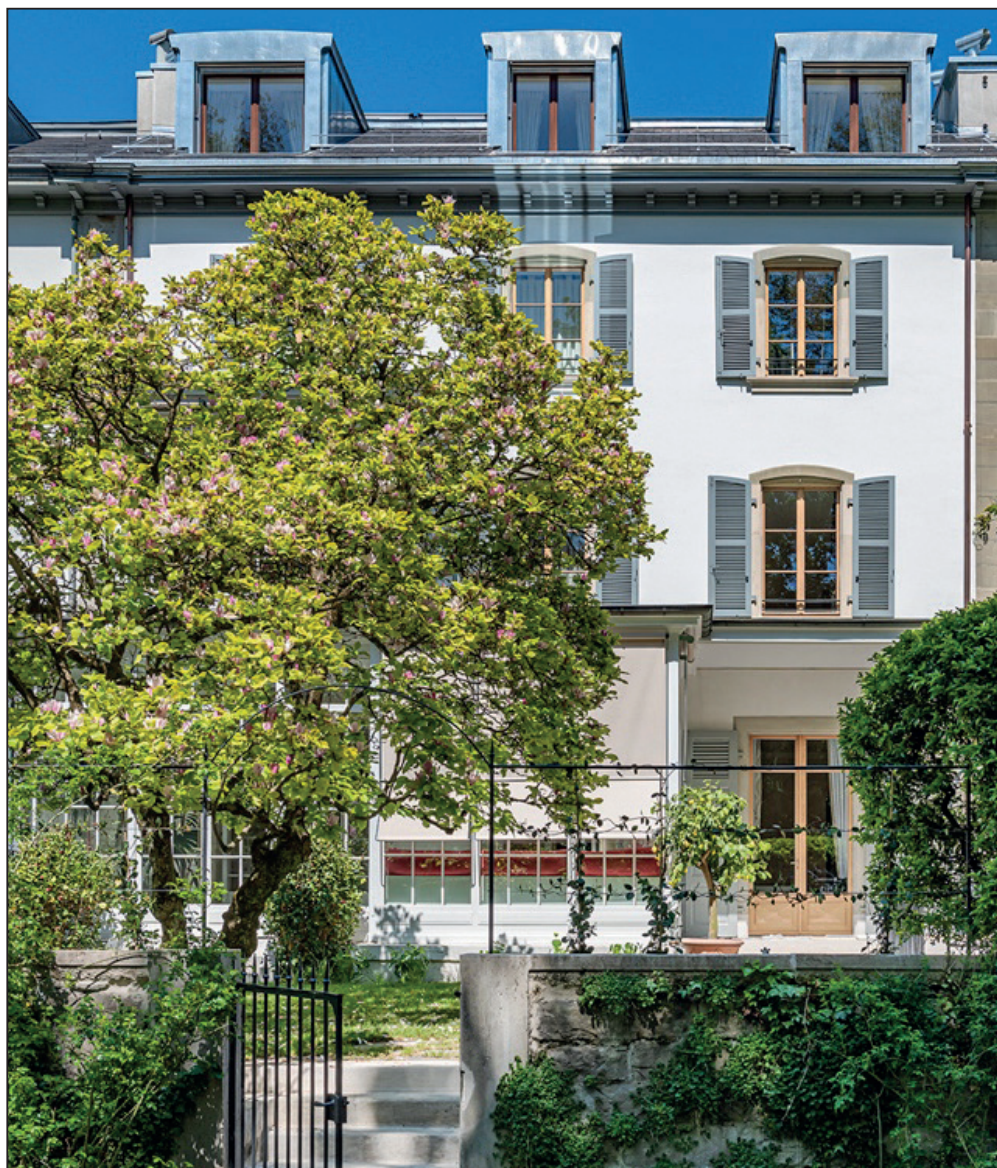
Cet ancien hôtel particulier, en plein cœur de Vieille Ville, a repris du lustre.