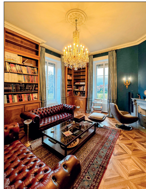
Au rez, la somptueuse bibliothèque d'origine a fait l'objet d'une restauration légère.

destruction de composants significatifs, suivant les recommandations du Service des monuments et des sites (SMS) et de la Commission des monuments, de la nature et des sites (CMNS) de l'Etat de Genève. Le résultat est exceptionnel: la maison offre à ses habitants un confort optimal, tout en gardant sa substance historique.