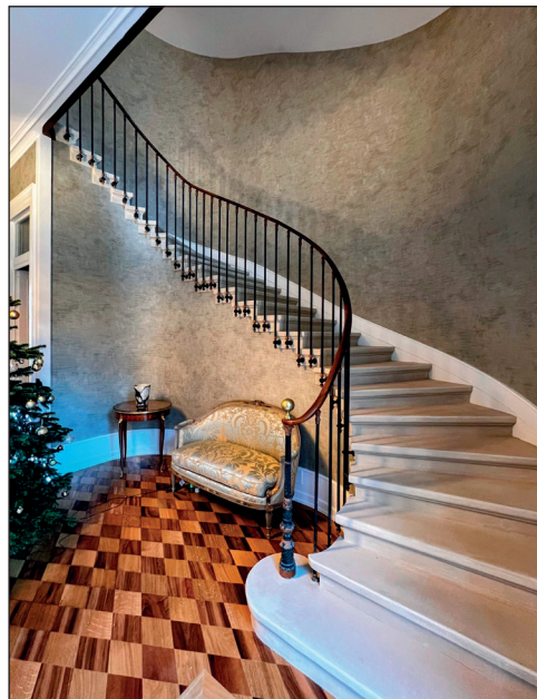
Un bel escalier central dessert la maison, du rez-de-chaussée aux combles.