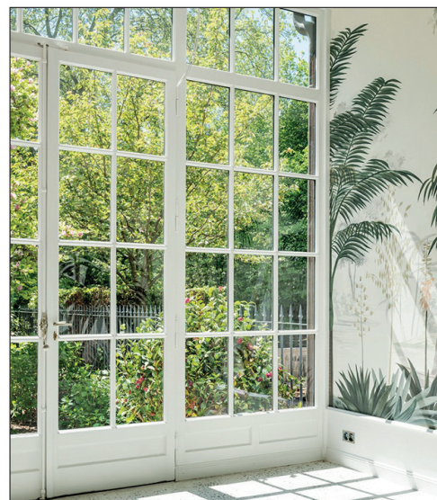
La véranda (verrière) existante, bordée de part et d'autre par une terrasse et un jardin d'hiver, a été légèrement agrandie et isolée.